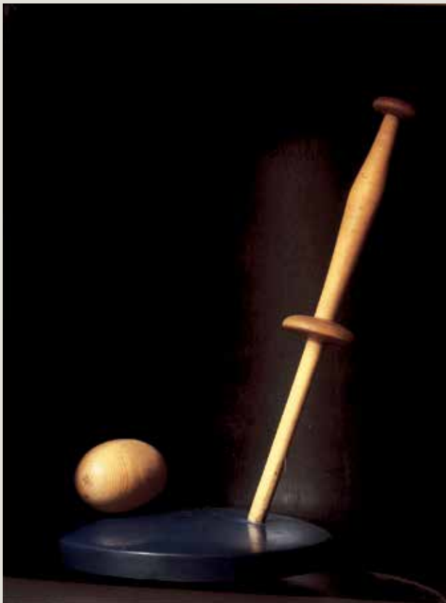
LEANDRE CRISTÒFOL. Nit de lluna (1935). Escultura. Museu d'Art Jaume Morera, Lleida.