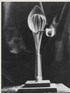
JAUME SANS. Verge romànica (entre el 1934 i el 1935). Escultura feta amb una cullera de fusta, una batedora de ferro i una peça de ceràmica. Fotografia de la peça desapareguda mostrada a l'exposició «Tres escultors que presenta ADLAN».