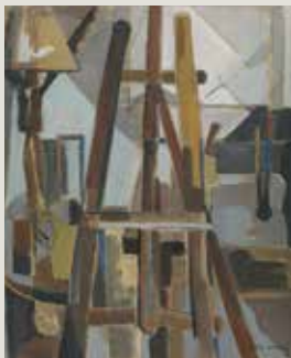
ALBERT RÀFOLS-CASAMADA. L'estudi del pintor (1955). Oli sobre tela. Col·lecció Bassat.

d'obres ens pot fer creure que no pensava en cap recorregut més enllà del seu propi gaudi i el de l'entorn més íntim. Sense tenir referències cronològiques clares, ni cap documentació personal que n'expliciti els orígens o motivacions, es fa difícil establir una genealogia i unes filiacions clares de la seva obra i el context artístic de l'època. Del que no hi ha dubte és que participava de la resistent escena cultural i estava al cas de les novetats: assistia a les tertúlies del cafè Bagatel·la i a les activitats del Club 49, on, a més d'antics membres d'ADLAN, també va conèixer i tractar les noves generacions d'artistes, entre els quals els de l'emergent grup Dau al Set.