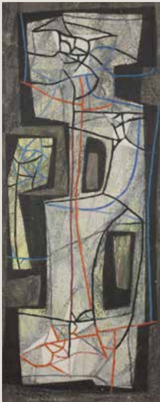
ERWIN BECHTOLD. Sense títol (c. 1955). Pintura sobre fusta. Col·lecció particular.