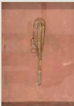
ANTONI CLAVÉ. Home amb monocle (1939). Escultura sobre fons de tela. Museu Nacional d'Art de Catalunya.

..... Una altra característica pròpia del surrealisme va ser el que entenem com a «poètica dels objectes» –la utilització d'objectes quotidians per revelar associacions de conceptes i d'imatges mentals–, com es pot observar en la icònica Nit de lluna , de Leandre Cristòfol (un ou de sargir i un fus de filar que funcionen com a al·legoria dels seus pares), o Verge romànica , de Jaume Sans (peça que posteriorment Antoni Clavé va replicar en el seu conegut Home amb monocle ).