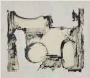
JAUME SANS. Sense títol (c. 1957). Pintura sobre paper. Col·lecció particular.

Així com els estímuls externs funcionaven com a incentiu, també és cert que el fet de no signar ni datar la majoria