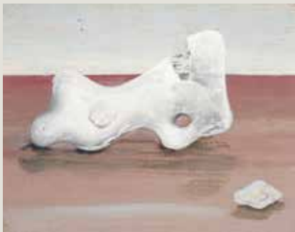
JAUME SANS. Miniatura (1934). Oli sobre fusta. Museu Nacional d'Art de Catalunya.