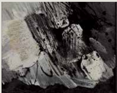
JOAN JOSEP THARRATS. VII L'autre côté de la terre (1959). Oli sobre tela. Col·lecció Bassat.

..... Sigui com sigui, dins la varietat formal i qualitativa dels seus treballs d'aquests anys, s'evidencia que va continuar investigant i que els resultats es troben a mig camí entre l'acostament a un model propi i l'assimilació –voluntària o involuntària– de determinades influències. Vist en perspectiva, a mesura que va deixar de banda el surrealisme eliminant paulatinament la figuració, va apropar-se a una abstracció constructivista i, posteriorment, cap a una obra de caràcter més matèric i informalista però sense els excessos de dramatismes i gestualitat formal més assentats en algun dels seus representants. En termes genèrics, podem trobar proximitat entre artistes i obres representatives dels anys cinquanta del segle passat –com Planimetria 58 , de Joan Vilacasas; Matèria gris , de Daniel Argimon i L'autre côté de la terre , de Joan Josep