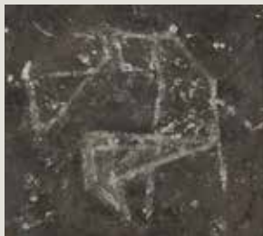
JAUME SANS. Sense títol (entre el 1945 i el 1960). Pintura sobre tela. Col·lecció particular.