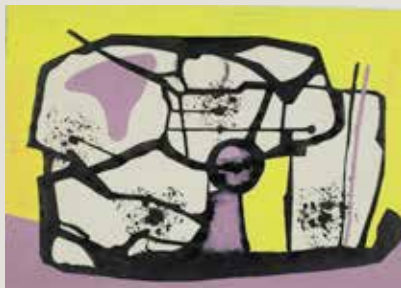
JAUME SANS. Sense títol (entre el 1945 i el 1960). Pintura sobre paper. Col·lecció particular.