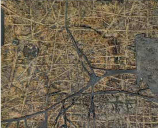
JOAN VILACASAS. Planimetria 58 (1958). Tècnica mixta. Col·lecció Bassat.