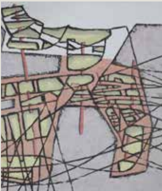
JAUME SANS. Sense títol (entre el 1945 i el 1960). Pintura sobre paper. Col·lecció particular.