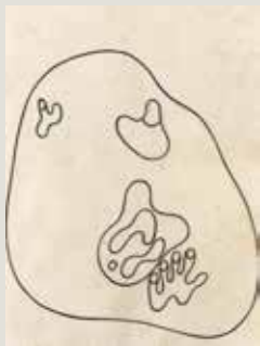
HANS ARP. Sense títol (sense data). Dibuix sobre paper. Col·lecció particular.

El col·lectiu ADLAN (1932-1936) va ser un revulsiu fonamental en les activitats artístiques prèvies a la Guerra Civil i, molt especialment, va reivindicar el surrealisme gràcies a exposicions i activitats on es presentava l'obra de Salvador Dalí, Hans Arp, Alexander Calder, Joan Miró, etc. Aquests autors són fonamentals a l'hora d'entendre les formes orgàniques, els automatismes, els somnis i l'ús de materials no convencionals en l'art per part dels que van participar en les ressenyades exposicions «Tres artistes que presenta