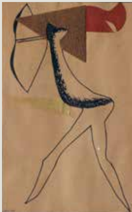
JAUME SANS. Collage (1935). Paper, tinta, tela i cartró. Museu Nacional d'Art de Catalunya.