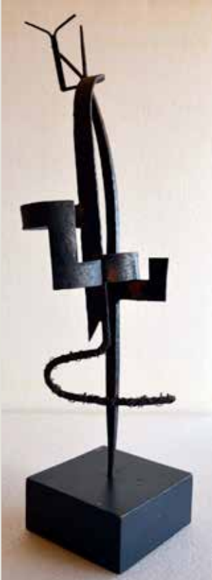
ÁNGEL FERRANT. Escultura cambiante (1958). Escultura de ferro forjat. Biblioteca Museu Víctor Balaguer. Vilanova i la Geltrú.