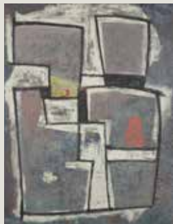
JAUME SANS. Sense títol (entre el 1945 i el 1960). Pintura sobre fusta. Col·lecció particular.